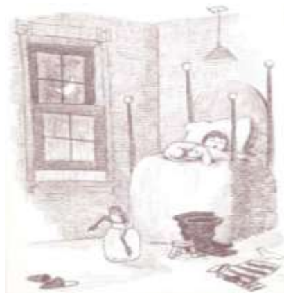
Image 2. Support de la tâche : « Frog, where are you? »