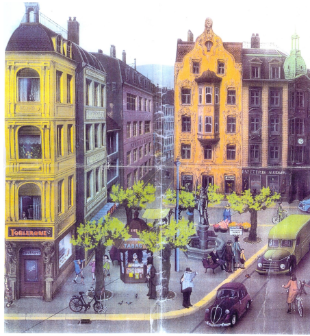
FIGURE 2 – Affiche d'un centre-ville

Lorsqu'un locuteur décrit cette affiche à un allocuteur « naïf », c'est-à-dire sans accès visuel à l'image, il doit linéariser cette grande quantité d'informations pour être compréhensible. C'est-à-dire créer des liens entre les différentes entités pour que son discours constitue un ensemble cohésif et ne soit pas une accumulation décousue de phrases sans rapport les unes avec les autres. Pour établir des liens entre ces entités, le locuteur peut procéder de différentes façons. En voici deux exemples (Arslangul et Watorek, 2020).