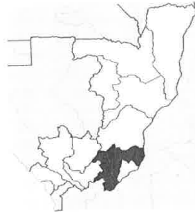
Carte 1. République du Congo : Région du Pool et Brazzaville 1