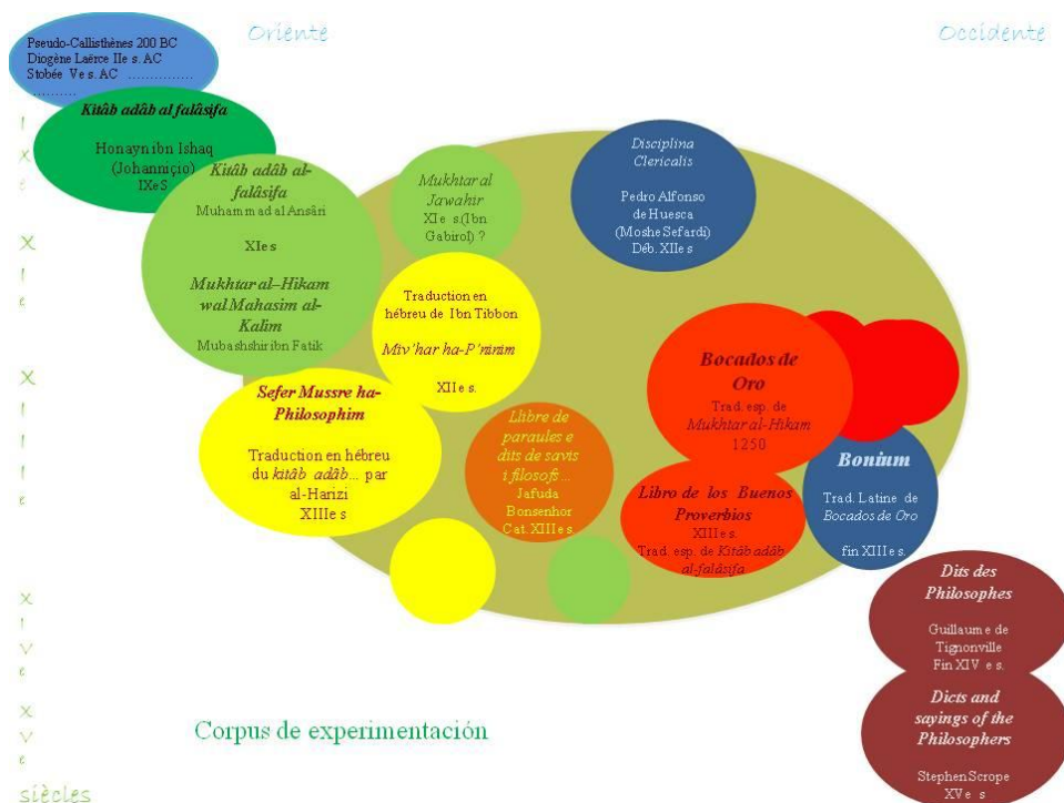
Ilustración 2: El texto de origen griego circula en varias versiones árabes, en dos versiones españolas, una versión en catalán, dos versiones en hebreo, dos en latín. No mencionamos las versiones en otras lenguas vernáculas. Esto no es más que un esquema simplificado.