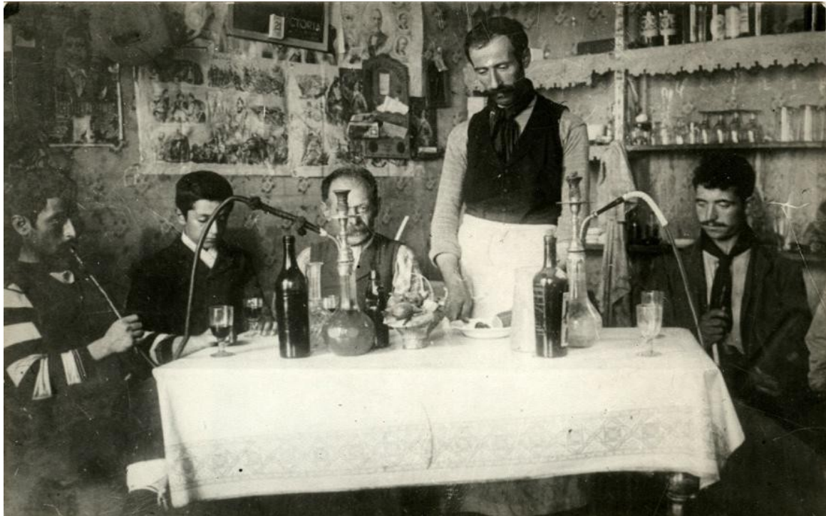
Image 4 - Un des cafés turcs à Buenos Aires, 1902 31