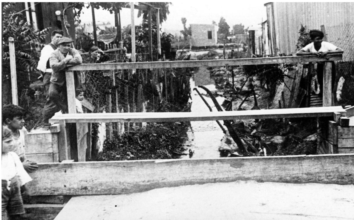
Image 3 - Le ruisseau Maldonado au début du XX e siècle 20

Le vieux lampadaire au coin de la rue avec sa lumière mourante, me dit que c'est vrai que le tango est né à Villa Crespo