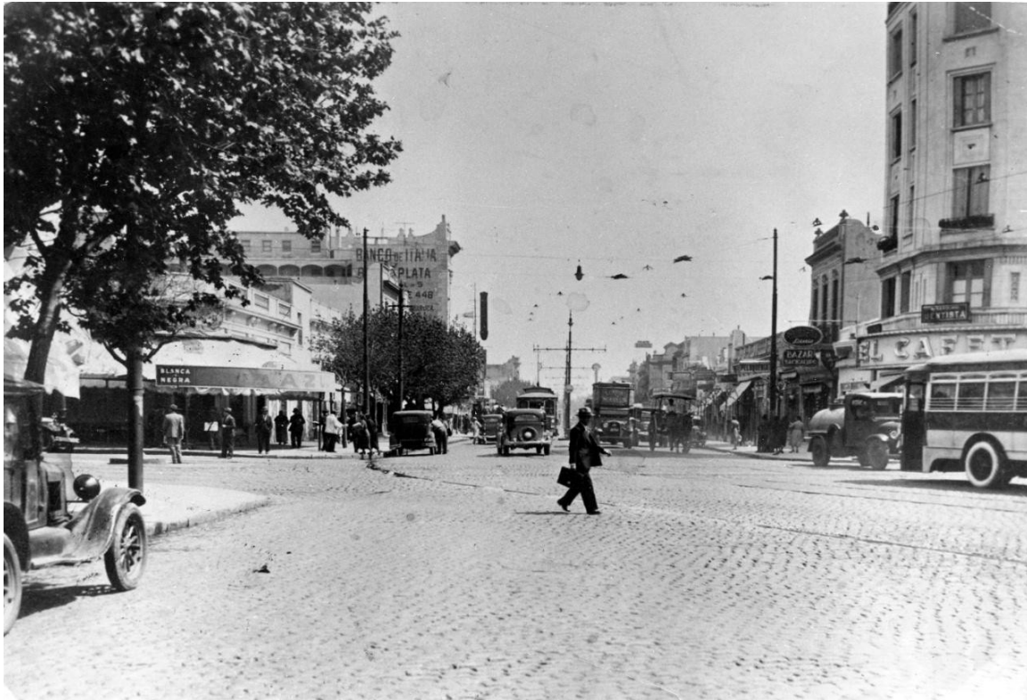
Image 2 - Le centre de Villa Crespo, les avenues Canning et Corrientes 18

Vers la fin du XIX e siècle (1888), la Fábrica Nacional de Calzado (« Usine Nationale de Chaussures ») arrive dans le quartier, et en 1901, la Curtiembre La Federal (Usine de cuir). Ces deux industries deviennent un pôle d'attraction pour ceux qui cherchent du travail, ce qui entraîne le changement profond du caractère de ce quartier. Cherchant à installer ses ouvriers près de l'usine, l'Usine Nationale de Chaussures commence la construction de maisons très particulières, avec un long couloir et de chaque côté de petites chambres. L'usine construit aussi de nombreuses rues pour faciliter l'accès au quartier naissant 19 . Les nouveaux immigrants s'installent dans ces grandes maisons, appelées conventillos - des maisons d'habitation dans lesquelles chaque famille occupe une chambre, avec une seule petite cuisine et des toilettes communes pour tout l'immeuble. Ces lieux se transforment en lieux de cohabitation entre les différents groupes migratoires.