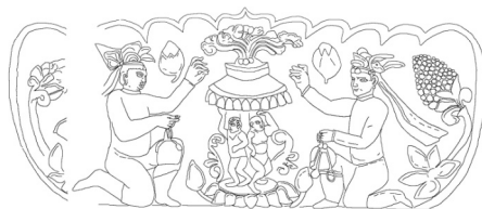
Fig. 2 : Médailillon central de la face antérieure du soubassement. Deux officiants agenouillés jettent de l'encens dans des braises incandescentes. H. 33 cm ; L. 74,5 cm ; ep. 8 cm. Chine du Nord, dernier quart du VI e siècle. Dessin F. Ory.

base du monument représente en effet un culte du feu non zoroastrien, tel que l'on peut parfois en apercevoir sur les bases de stèles bouddhiques du Gandhāra (Fig. 2, voir également planche 8) 60 . Il est ainsi intéressant de noter que les religions tant iraniennes, que turques ou indiennes, accordent une réelle importance au culte du ciel et au culte du feu. On sait grâce à Théophylacte Simocatta que « les Turcs tiennent le feu en honneur d'une manière très extraordinaire ; ils vénèrent aussi l'air et l'eau ; ils célèbrent la terre ; mais n'adorent et n'appellent dieu que le seul auteur du ciel et de la terre. Ils lui sacrifient des chevaux, des bœufs et des moutons, et ils ont des prêtres qui leur paraissent prédire l'avenir ». 61 Il n'est donc pas difficile d'imaginer qu'une certaine confusion ait pu s'installer dans l'esprit des auteurs chinois de l'époque, lorsqu'il s'agissait de qualifier la religion de ces peuples qu'ils ne considéraient finalement que comme des hu .