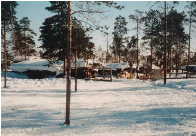
Campement sur la Tiouïtiaha (région de l'Agan), Photo Eva Toulouze, 1999.

Il semble bien donc que la dimension linguistique ne joue qu'un rôle minime dans la conscience identitaire des Nenets des forêts.