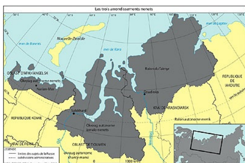
Les trois arrondissements nenets

Culturellement, l' okroug nenets, du côté européen, se distingue des autres par le fait que les Nenets qui l'habitent ont été en contact avec le monde russe depuis des siècles. Les Nenets du Iamal en étaient beaucoup plus isolés: si Obdorsk, aujourd'hui Salekhard, était un lieu d'exil et un centre régional, la péninsule elle-même était terra incognita pour les autorités jusqu'à la fin des années 1920. V.Evladov, fonctionnaire soviétique chargé d'étudier un projet d'assurance sur les rennes, y avait passé près de deux ans en 1926-27, étudiant les clans et leurs itinéraires. Il avait découvert que pour beaucoup, ces hommes de la toundra n'avaient guère entendu parler de la Révolution [2].