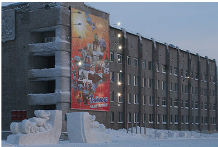
L'administration du raïon municipal du Taïmyr à Doudinka (Photo: © Kaur Mägi).

Plus isolé que les autres du fait de conditions fort peu propices à la vie humaine, l' okroug du Taïmyr, habité aujourd'hui par moins de 40.000 personnes, est encore plus lointain que l' okroug Iamalo-nenets. Son chef lieu est le bourg de Doudinka, qui aujourd'hui fait effet d'un village comparé à la grande ville voisine de Norilsk.